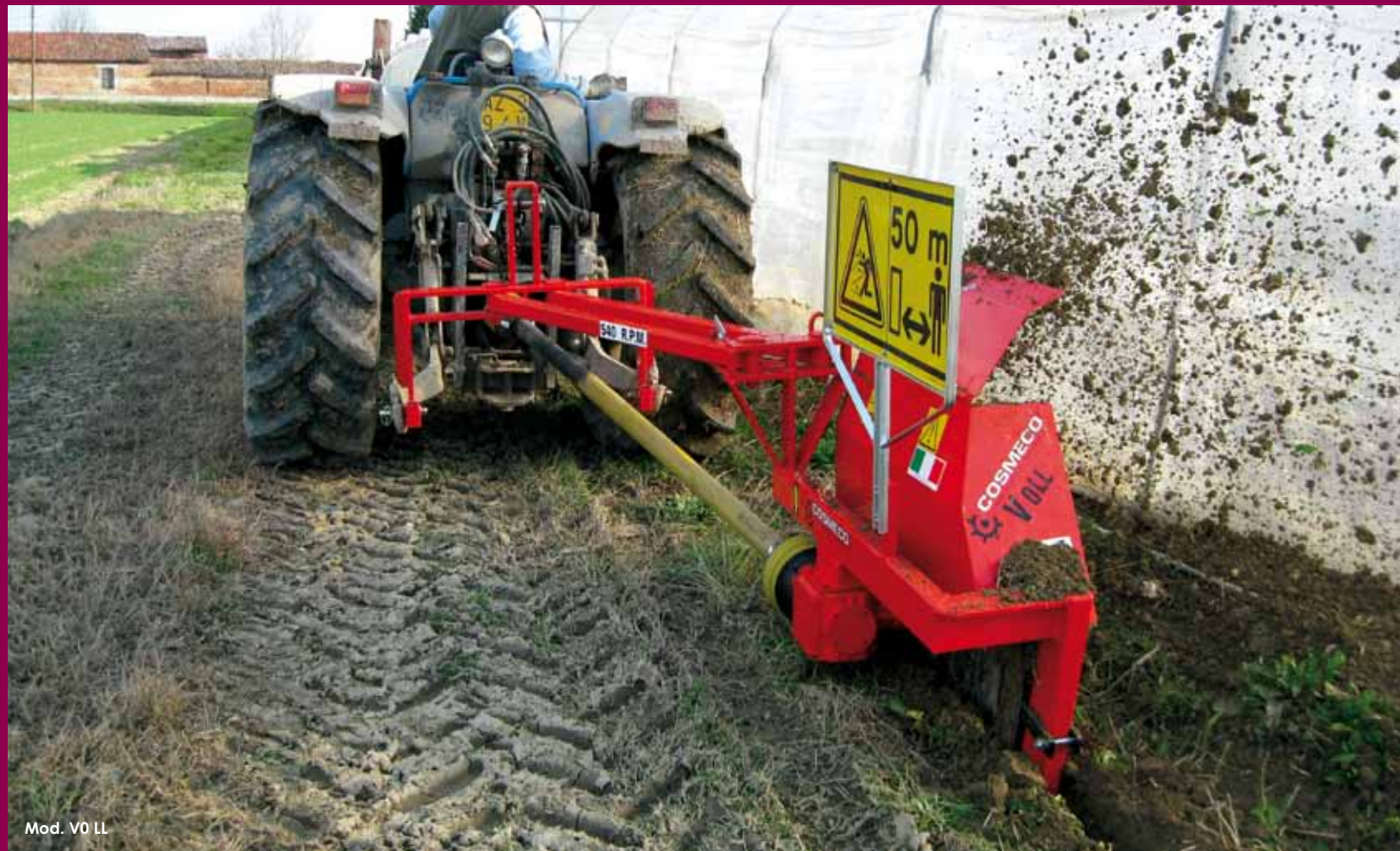
Mod. V0 LL