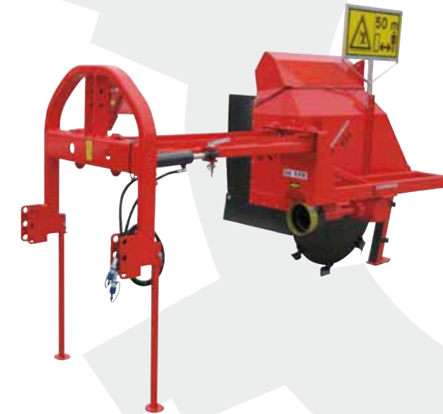
Sezione di lavoro - Ditch section